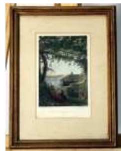
1241 ▪ Porto - "Seminary from the Freixo" gravura pintada sobre papel, Porto, séc. XIX, sinais de humidade. Dim. - 16, 5 x 11 cm Base de licitação: € 10