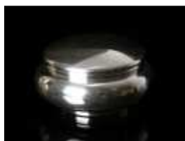
1134 ▪ Caixa prata de 833 milésimos, contraste de Lisboa (1887-1937). Dim. - 6,5 x 13,5 cm ; Peso: 355,6 g. Base de licitação: € 120