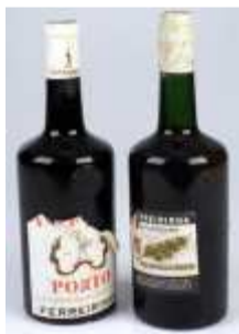
1131 ▪ Porto Ferreira Extra Seco - 2 garrafas A.A. Ferreira, Succrs., Porto, rótulos danificados. Base de licitação: € 15