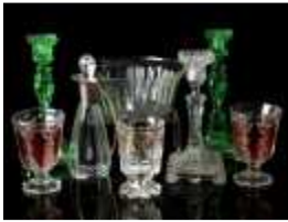
1162 ▪ Par de castiçais, castiçal, três copos, jarro e froma de pudim pirex, vidro colorido e pintado, jarro de pequenas dimensões com pega em casquinha, séc. XX, pequenas faltas e defeitos. Dim. - 25 cm Base de licitação: € 40