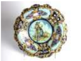
1168 ▪ Prato de suspensão porcelana de Alcobaça, decoração policromada, rebordo vazado, séc. XX, pequenas faltas e defeitos. Dim. - 38,5 cm Base de licitação: € 40