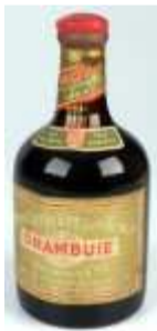
954 ▪ Licor Drambuie Escócia, garrafa antiga. Base de licitação: € 6