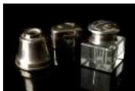
1135 ▪ Três tinteiros, sendo um de viagem dois em metal, um dos tinteiros com tampa em prata de 833 milésimos, contraste do Porto (1887-1937), faltas e defeitos. Dim. - 6 x 5 x 5 cm ; Peso: 18,2 g. Base de licitação: € 20