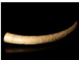
1170 ▪ Presa esculpida marfim esculpido "Animais", séc.XX (anos 60), estalada. Dim. - 80 x 8,5 cm Base de licitação: € 200