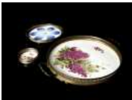
1167 ▪ Três majólicas rebordos em metal, decoração com flores, se'c. XX, pequenas faltas e defeitos. Dim. - 31 cm (maior). Base de licitação: € 20