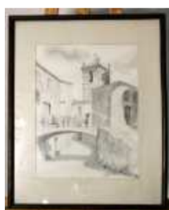
1242 ▪ "Paisagem rural" lápis sobre papel, séc. XX, assinado. Dim. - 37 x 27 cm Base de licitação: € 5