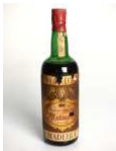
1132 ▪ Madeira Malmsey Duke of Clarence rótulo ligeiramente danificado. Base de licitação: € 20