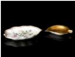
1165 ▪ "Parras" duas parras em porcelana da fábrica da Vista Alegre, decorações policromada e dourada, marcas nº 32 (1947-1968) e 39 (1997-2001), uma com restauro, desgastes no dourado. Dim.- 3 x 22,5 cm. Base de licitação: € 30