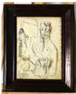
1240 ▪ "Fado ainda há o que não são fadistas" - THOMAZ DE MELLO caneta sobre papel, datado de 1947, com inscrição no verso, sinais de humidade. Dim. - 23 x 17 cm Base de licitação: € 25