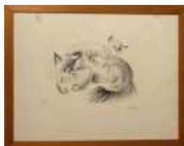
1244 ▪ "Sem título" - MILY POSSOZ gravura sobre papel, numerada XII/XV, séc. XX. Dim. - 39 x 52 cm Base de licitação: € 200