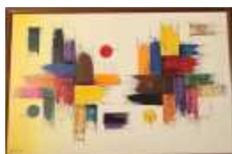
1246 ▪ "Sem título" - Rute Miltom tela sobre cartão, assinado e datado de 97. Dim. - 76 x 117 cm Base de licitação: € 80