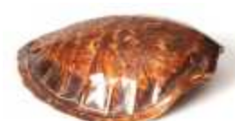
1169 ▪ Carapaça de tartaruga envernizada, séc. XX, pequenos defeitos. Dim.- 43 x 41 cm. Base de licitação: € 300