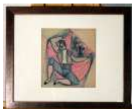
1245 ▪ "Sem título" - ANTÓNIO LINO técnica mista sobre papel, séc. XX. Dim. - 22 x 20 cm Base de licitação: € 60