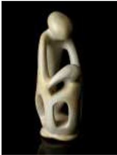
1164 ▪ "Sem título" pedra, séc. XX, pequenos defeitos. Dim. - 21 cm Base de licitação: € 25