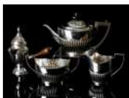
1136 ▪ Serviço de chá casquinha, decoração gomada, conjunto composto por: bule, leiteira, chocolateira com pega em madeira e açucareiro, séc. XX. Dim. -16 x 26 x 11 cm Base de licitação: € 80