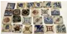
1166 ▪ Vinte e quatro azulejos diversos decorações policromada, pequenas faltas e defeitos. Dim. 14 x 14 cm. Base de licitação: € 40