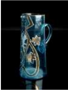
1163 ▪ Jarro "Mary Gregory" vidro azul, decoração a branco e dourado, séc. XIX, pequenas faltas e defeitos. Dim. - 25 cm Base de licitação: € 50