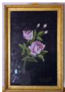
1243 ▪ "Flores" pastel sobre papel, assinado, séc. XX. Dim. - 49 x 31 cm Base de licitação: € 35