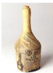
1133 ▪ Licor Bénédictine França, papel de protecção intacto. Base de licitação: € 8