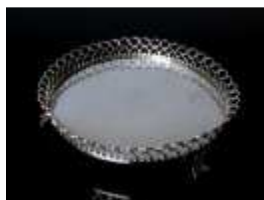
1137 ▪ Salva de gradinha com três pés prata de 833 milésimos, marca municipal da cidade de Lisboa, séc. XX, pequenas faltas e defeitos. Dim. - 19 cm ; Peso:294.8 g. Base de licitação: € 150