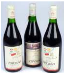
957 ▪ Herdade do Esporão 1987 e 1991-três garrafas Reguengos, uma com rótulo de Manuel Cargaleiro (87) duas de José de Guimarães (91). Base de licitação: € 60