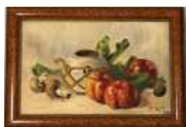
1138 ▪ "Natureza Morta" - MARIA DE LURDES - 1940 óleo sobre tela, sinais de humidade. Dim. - 24 x 38 cm Base de licitação: € 60