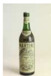
505 ▪ Martini Dry 1L., 18º Base de licitação: € 5