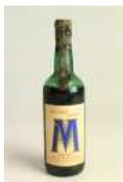
501 ▪ Vinho da Madeira M Meio Doce 70 cl., Companhia Vinicola da Madeira, Lda. Base de licitação: € 15