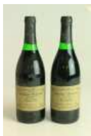
500 ▪ 2 garrafas - Caves Dom Teodósio Garrafeira Particular tinto 75 cl., 12º Base de licitação: € 15