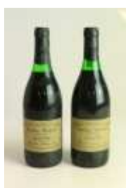
502 ▪ 2 garrafas - Caves Dom Teodósio Garrafeira Particular tinto 75 cl., 12º Base de licitação: € 15