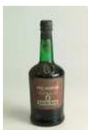
504 ▪ Picador Port Fine Tawny 75 cl. Base de licitação: € 15