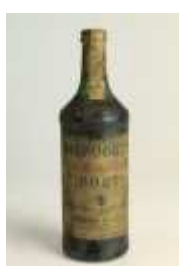
506 ▪ Niepoort 20 Years Old Tawny Port 75 cl., engarrafado em 1975 Base de licitação: € 25