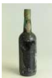
503 ▪ Vinho da Madeira 75 cl., sem rótulo Base de licitação: € 1