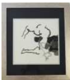
1175 • "Catch - Luta Burlesca" - JÚLIO POMAR serigrafia sobre papel, assinada, numerada 35/99, emoldurada. Dim. - 27 x 27 cm Base de licitação: € 120