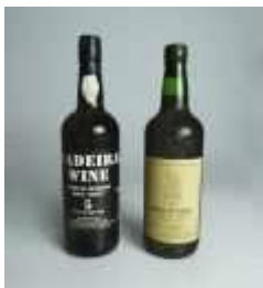
893 ▪ Vinho da madeira doce 5 anos e Quinta do Torgal Porto 1963 75 cl., garrafa de Porto sem cápsula de protecção. Base de licitação: € 10