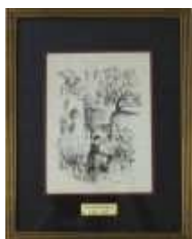
497 ▪ "Cena de exterior" - BERNARDO MARQUES (1898-1962)

gravura a negro sobre papel, séc. XX, emoldurada. Dim. - 20 x 15,5 cm.