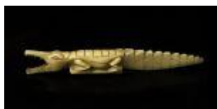
873 ▪ Crocodilo escultura em marfim entalhado, séc. XX (anos 40/50), faltas e defeitos. Peso: 152,30 grs. Dim. - 24,5 cm. Base de licitação: € 60