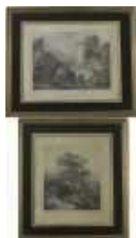
1176 • "Paisagens" duas gravuras francesas a negro sobre papel, emolduradas, séc. XIX, manchas de humidade. Dim. - 31 x 38,5 cm. Base de licitação: € 30