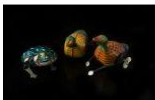
877 ▪ Três patos e sapo folha litografada policromada, mecanismo a corda, séc. XX, pequenos defeitos. Dim.- 8 x 10 cm Base de licitação: € 10