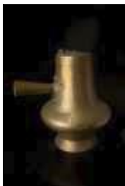
579 • Chocolateira cobre martelado, séc. XX, faltas e defeitos, falta da pega, oxidação. Dim.- 23 x 23 cm Base de licitação: € 20