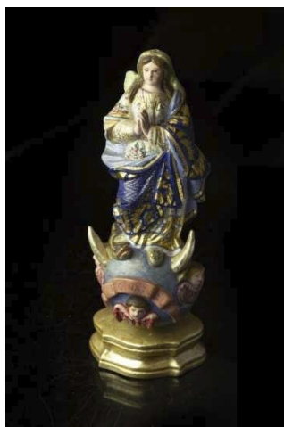
1283 • "Nossa Senhora da Conceição"

escultura em madeira policromada e dourada, olhos em vidro, séc. XIX, pequenos defeitos. Dim. - 25 cm