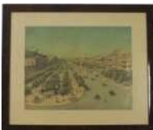
659 • "Avenida da Liberdade" cromolitografia sobre papel, emoldurada, séc. XX. Dim. - 31 x 39,5 cm. Base de licitação: € 40