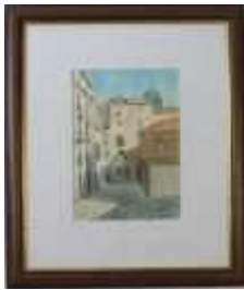
654 • "Casario" - Carlos Alberto aguarela sobre papel, emoldurada, assinada e datada de 1981. Dim. - 30 x 21 cm. Base de licitação: € 80