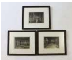
1178 • "Interiores arquitetónicos" Três gravuras inglesas sobre papel, assinadas, emolduradas, manchas de humidade. Dim. - 18,5 x 23 cm. Base de licitação: € 20