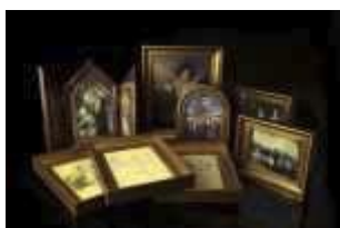
499 ▪ Oito estampas

emolduradas, temática religiosa e outras, séc. XX. Dim. - 27,5 x 27,5 cm.