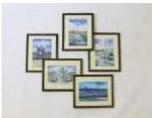
573 • "Lisboa" - J. MORAIS (séc. XX) cinco aguarelas sobre papel, assinadas, emolduradas. Dim. - 20 x 12,5 cm. Base de licitação: € 20