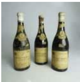
891 ▪ Montaria 4XX Colheita de 1965 - três garrafas Taylor, Fladgate & Yeatman, 75 cl., rótulos danificados. Base de licitação: € 10