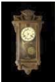
577 • Relógio parede madeira, mostrador e pêndulo em latão e outros materiais, numeração romana, com chave, séc. XX, pequenos defeitos, mecanismo não testado. Dim. - 63 x 28 x 14 cm. Base de licitação: € 40