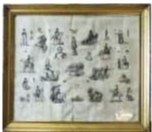
1096 • "Souvenirs d'un Grand Homme" gravura sobre papel, séc. XIX, defeitos, sinais de humidade. Dim. - 30 x 36 cm Base de licitação: € 30