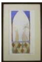
496 ▪ "Figuras" - VERA VELEZ (séc. XX)

técnica mista sobre papel, assinada e datada 85, emoldurada. Dim. - 30 x 17 cm.