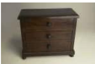
578 • Guarda-joias em forma de cómoda madeira, com três gavetas, séc. XX, pequenas faltas e defeitos. Dim.- 23 x 27 x 12,5 cm Base de licitação: € 30