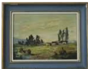
1093 • "Paisagem" - HILÁRIO ROBERTO (NASC. 1927) óleo sobre platex, assinado, pequenas faltas e defeitos. Dim.- 21 x 28,5 cm Base de licitação: € 60