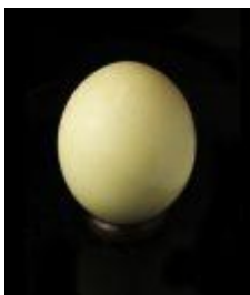
870 ▪ Ovo de avestruz séc. XX. Dim. - 15 cm. Base de licitação: € 20