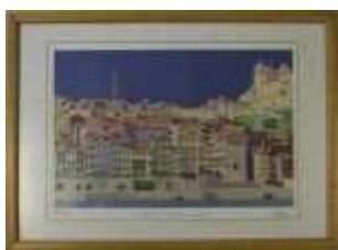
494 ▪ "O Porto e a Torre dos Clérigos" - DUARTE BOTELHO (1953-)

serigrafia sobre papel, prova de artista, assinada e datada 1991, numerada 14/25, pequenos defeitos na moldura. Dim. - 39 x 55 cm.