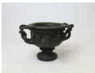
1098 • Ânfora bronze, decorada com deuses da mitologia greco-romana, patinado, séc. XX, defeitos. Dim. - 24 x 36 cm Base de licitação: € 80