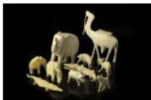
871 ▪ "Dez Animais" esculturas em marfim entalhado, sendo camelo, quatro elefantes, dois crocodilos, duas corsas e hipopótamo, séc. XX (anos 50), faltas e defeitos. Peso: 955,79 grs. Dim. - 16,5 x 14 x 3 cm. (maior) Base de licitação: € 80