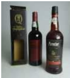
890 ▪ Porto Armilar Rosé e Quinta do Infantado Ruby 75 cl Base de licitação: € 8