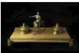
575 • Tinteiro "D. Quixote" bronze com base em madeira, recipientes em forma de torres, pés em forma de mascarões, séc. XX, faltas e defeitos, oxidação. Dim.- 14 x 32 x 13 cm Base de licitação: € 40