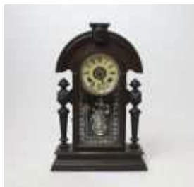
576 • Relógio de capela madeira, decorada com mascarões, mostrador em folha metálica estampada, porta em vidro, fabrico americano, com pêndulo e chave, séc. XX, mecanismo por testar, pequenas faltas e defeitos. Dim- 53 x 35 x 12 cm. Base de licitação: € 30