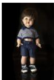
878 ▪ Boneco "Juanin Perez" marca MARIQUITA PEREZ plástico e outros materiais, marcado non pescoço e costas, com as roupas originais. Dim.- 48 cm Base de licitação: € 40