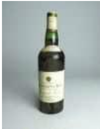
889 ▪ Carcavelos Quinta do barão Última Reserva Raúl Ferreira & F.ª Lda., 0,75 cl. Base de licitação: € 20