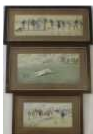
1180 • "Cenas de caça" três técnicas sobre papel, emolduradas, séc. XX, manchas. Dim. - 31,5 x 57,5 cm. Base de licitação: € 20