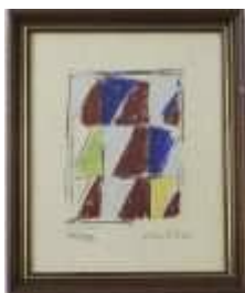
1092 • "Sem título" - ROCHA PINTO (NASC. 1951) serigrafia sobre papel, assinada e datada 84, numerada XVII/XXX, pequenos defeitos na moldura. Dim.- 16 x 12 cm Base de licitação: € 40