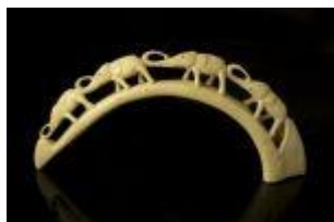
872 ▪ "Elefantes" presa de facochero (javali africano) entalhada e vazada, África, séc. XX (anos 40), defeitos. Dim. - 59 cm. (curvatura exterior) Base de licitação: € 40