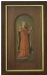
655 • Arcanjo impressão, emoldurada. Dim. - 25,5 x 9,5 cm. Base de licitação: € 10