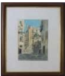
656 • "Casario" - Carlos Alberto aguarela sobre papel, emoldurada, assinada e datada de 1981. Dim. - 30 x 22 cm. Base de licitação: € 80