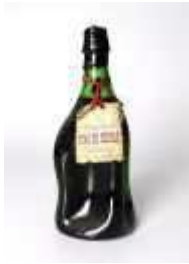
888 ▪ Aguardente Fim de Século Velhíssima Real Companhia Vinícola do Norte, 75 cl. Base de licitação: € 10