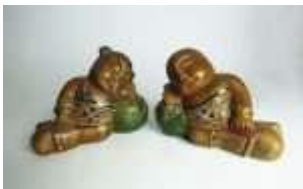
574 • Par de figuras orientais esculturas em madeira entalhada em parte pintada, com aplicações em vidro colorido, séc. XX, faltas. Dim. - 17,5 x 23 x 11 cm. Base de licitação: € 20