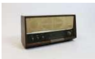
500 ▪ Rádio

madeira folheada, baquelite e outros materiais, marcado "POLKA", Alemanha, séc. XX, mecanismo não testado. Dim. - 30 x 55 x 17 cm