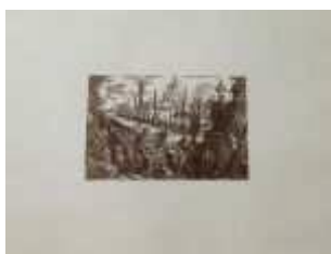
1179 • "Piranesi - Invenções, Caprichos, Arquiteturas" estampa sobre papel, segundo obra do autor, edição do Instituto Português do Património Arquitetónico e Arqueológico, na capa original. Dim. - 56,5 x 77 cm. Base de licitação: € 10