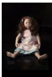
876 ▪ Boneca "Danny" marca ZWERGNASE plástico pintado e outros materiais, marcada e datada 2002, Alemanha, com as roupas originais, falta dos sapatos. Dim. - 48 cm. Base de licitação: € 30