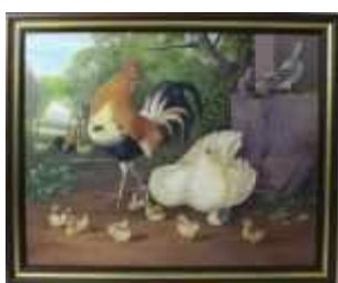
1095 • "Galinhas" - F. AMARAL (séc. XX) óleo sobre tela, assinado e datado de 1987, emoldurado. Dim. - 78 x 100 cm. Base de licitação: € 80