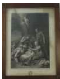
1094 • "Adoração do Menino" gravura sobre papel, emoldurada, séc. XIX, manchas de humidade, faltas. Dim. - 65 x 47,5 cm. Base de licitação: € 40