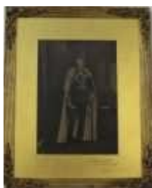
1097 • Rei Jorge V de Inglaterra fotografia sobre papel, datada de 1902, moldura em madeira entalhada e dourada com flores em relevo, faltas. Dim. - 55 x 45 cm. Base de licitação: € 40