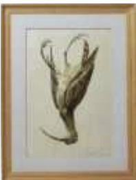
658 • "Maçarico" - JULIO TEIXEIRA BASTOS óleo sobre tela, não assinado e não datado, séc. XIX/XX, pequenos defeitos. Dim.- 40 x 26 cm Base de licitação: € 30