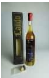
892 ▪ Vinho Lagido Pico V.L.Q.P.R.D. 1997 Cooperativa Vitivinícola da Ilha do Pico, 0,50 l., com caixa original em cartão. Base de licitação: € 8