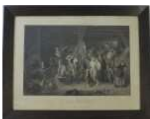
1177 • "Le Saltimbanque" gravura sobre papel, emoldurada, séc. XX, manchas no papel. Dim. - 35,5 x 52,5 cm. Base de licitação: € 40