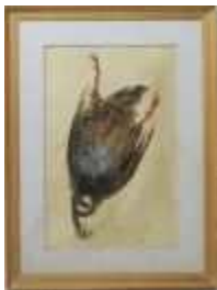
657 • "Perdiz" - JULIO TEIXEIRA BASTOS óleo sobre tela, não assinado e não datado, séc. XIX/XX, pequenos defeitos. Dim.- 39 x 26 cm Base de licitação: € 30