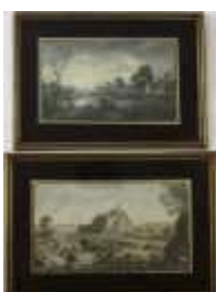
1181 • "Paisagens" duas estampas coloridas sobre papel, emolduradas, séc. XX, manchas de humidade. Dim. - 15,5 x 26 cm. Base de licitação: € 10