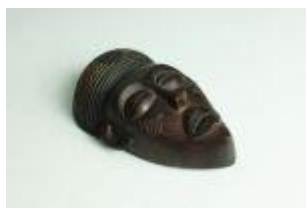
874 ▪ Máscara africana escultura em madeira entalhada e pintada, séc. XX, desgastes. Dim. - 24 cm. Base de licitação: € 30