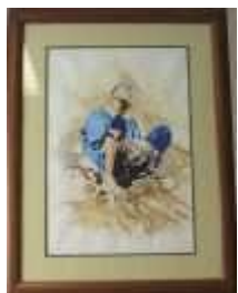
498 ▪ "Figura Masculina" - Essaihi Abdeslam (1952-) (?)

técnica mista sobre papel, assinado, emoldurada. Dim. - 47,5 x 32 cm.