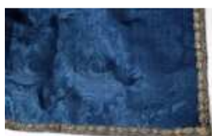
576 :: Toalha de altar seda adamsada, portuguesa, séc. XX, pequenos defeitos. Dim. - 259 x 163 cm Base de licitação: € 50