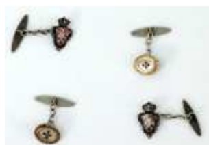
571 :: Dois pares de botões de punho "Armas de Portugal" e ovals ouro e prata portuguesa, aplicação de esmaltes policromados e madrepérola, contrastes do Porto (1938-1984). Peso - 11,5 grs. Base de licitação: € 20