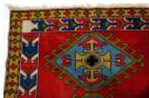
578 :: Tapete fio de lã, decoração policromada ao gosto oriental, séc. XX, pequenos defeitos. Dim. - 210 x 120 cm Base de licitação: € 50