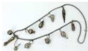
572 :: Fio prata portuguesa com 10 pendentes, séc. XX, marcados. Peso - 53 grs. Base de licitação: € 20