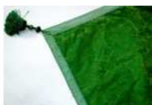
579 :: Pano de armar seda lavrada, séc. XX, pequenos defeitos. Dim. - 220 x 210 cm Base de licitação: € 60