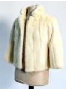
1134 • Jaqueta vison. Dim. 60 x 50 cm Base de licitação: € 370