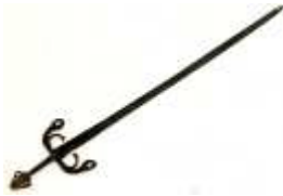
1130 • Espada ao estilo das "espadas caranguejas" usadas pelos navegadores portugueses e reproduzidas em diversos dos territórios coloniais portugueses. Reprodução museológica do séc. XX. Base de licitação: € 120