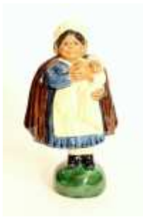
figura de movimento em faiança policromada, Fábrica das Caldas, séc. XX, pequenas faltas e defeitos. Dim. - 22 cm