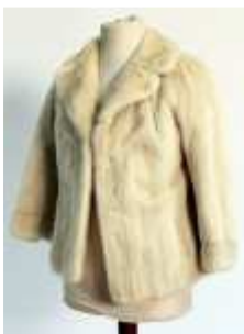
1133 • Jaqueta vison. Dim. 66 x 50 cm Base de licitação: € 370