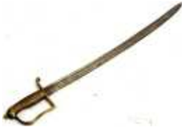
1129 • Terçado Dim. 68 cm Base de licitação: € 80