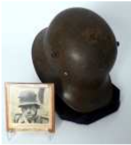
1128 • Capacete alemão em ferro, modelo da época da Primeira Guerra Mundial Base de licitação: € 300