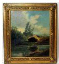
1191 • "Rochedo" - Romero óleo sobre cartão, assinado e datado 1914. Dim. - 63 x 52 cm Base de licitação: € 150