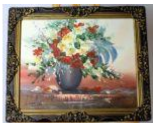
1194 • "Jarra de Flores" - O. Martins óleo sobre tela, assinado, séc. XX. Dim. - 40 x 50 cm Base de licitação: € 35