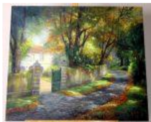
1188 • "Final de Outono em Sintra" - WARIZA ENGEL óleo sobre tela, assinado, séc.XX. Dim. - 70 x 80 cm Base de licitação: € 60