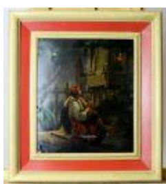
1193 • "Romeu e Julieta" óleo sobre folha metálica, Europa, séc. XX. Dim. - 24 x 21 cm Base de licitação: € 40