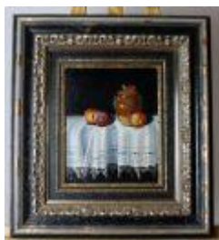
1190 • "Natureza-morta" óleo sobre tela, assinado, séc. XX. Dim.- 26 x 21 cm Base de licitação: € 30