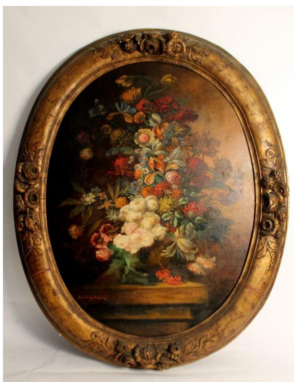
Lote 1276 • Natureza Morta