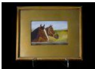
1189 • "Cavalos" - E.E.P. óleo sobre cartão, assinado, séc. XX. Dim. - 10 x 15 cm Base de licitação: € 50