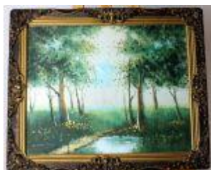
1195 • "Paisagem Campestre" - O. Martins óleo sobre tela, assinado, séc. XX. Dim. - 40 x 50 cm Base de licitação: € 35