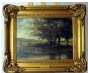
1192 • "Paisagem com vacas" - Julie Johnson óleo sobre tela, assinado. Dim. - 29 x 39 cm Base de licitação: € 120