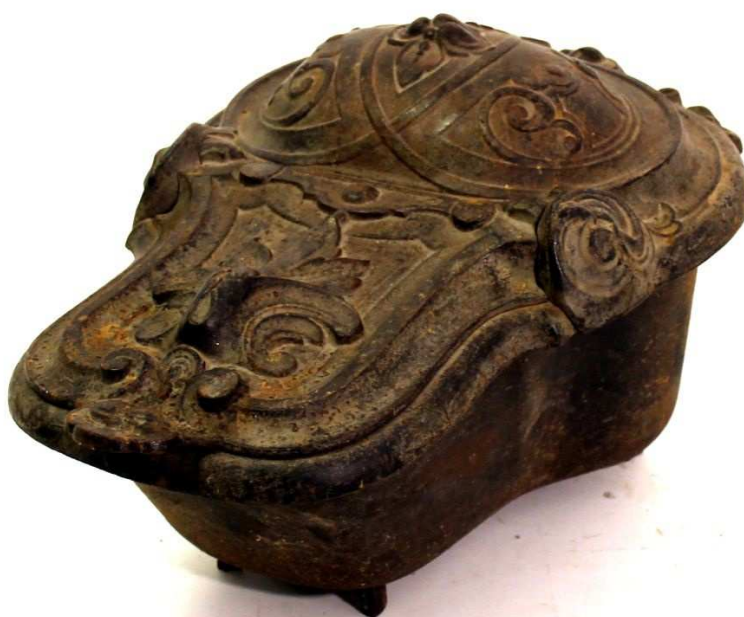
Lote 650 - Caixa para lenha ferro relevado, séc.XIX, oxidações. Dim. - 34 x 65 x 44 cm