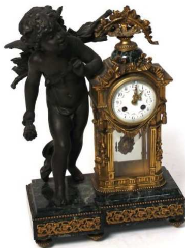
Lote 1378 - Relógio de mesa

bronze dourado e negro com base e aplicação em mármore, decoração com putti e grinaldas, mostrador em esmalte, séc. XIX-XX, pequenas faltas e defeitos, mecanismo a necessitar de revisão, falta da chave. Dim. - 50 x 32 x 16 cm