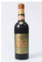
477 :: Real Madeira Reserva de Ouro, anos 70. Base de licitação: € 15