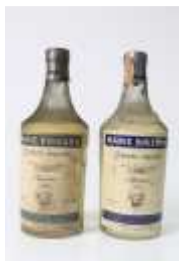
478 :: MARIE BRIZARD - conjunto de 2 garrafas antigas. Base de licitação: € 10