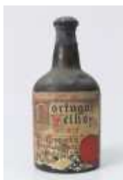
481 :: Vinho do Porto Portugal Velho nº 2 Real Companhia Vinicola do Norte de Portugal, anos 60. Base de licitação: € 20