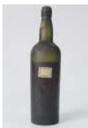
482 :: Vinho "Surpresa" - garrafa bordalesa com rótulo privado em branco. Base de licitação: € 10