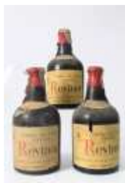
479 :: Vinho do Porto REVINOR - conjunto de 3 garrafas. Garrafas antigas, anos 60/70, dois dos rótulos com faltas. Base de licitação: € 30