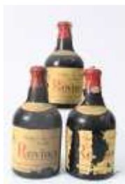
476 :: Vinho do Porto REVINOR - conjunto de 3 garrafas. Garrafas antigas, anos 60/70, dois dos rótulos com faltas. Base de licitação: € 30