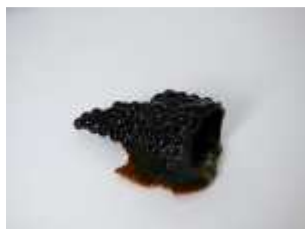
480 :: Jarra de suspensão decoreção naturalista, marca das Caldas da Rainha, séc. XX, pequenas faltas e defeitos. Dim. - 20,5 cm Base de licitação: € 25