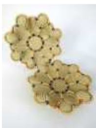
823 ▪ Par de cestos porcelana, decoração vazada e entrelaçada "flores", europeias, séc. XX, pequenas faltas e defeitos. Dim. - 30,5 cm Base de licitação: € 75