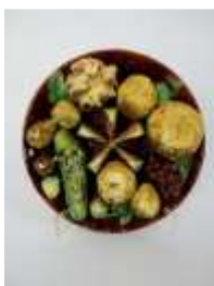
824 ▪ Prato faiança das Caldas da Rainha, decoração naturalista "frutas", séc. XX, pequenas faltas e defeitos. Dim. - 27 cm Base de licitação: € 75