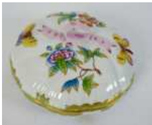
822 ▪ Terrina porcelana, decoração policromada "flores" e "borboletas", marcada HEREND HUNGARY, séc. XX, pequenas faltas e defeitos. Dim. - 10 x 16,5 cm Base de licitação: € 40