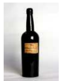
826 ▪ Theodorico Vieira Pimentel Douro Favaio 1878 Rótulo privado manuscrito, vinho generoso. Base de licitação: € 20