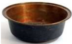
821 ▪ Alguidar de arame séc. XX, pequenos defeitos. Base de licitação: € 30