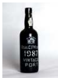
825 ▪ Vinho do Porto Vintage 1987 Real Companhia Velha, 75 cl. Base de licitação: € 25