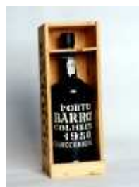
827 ▪ PORTO BARROS COLHEITA 1980 ALOIRADO-DOCE.; 75 Cl. Com caixa de origem em madeira. Base de licitação: € 15